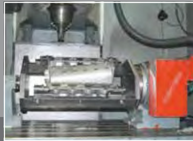
Anwendungsbeispiel 4. Achse