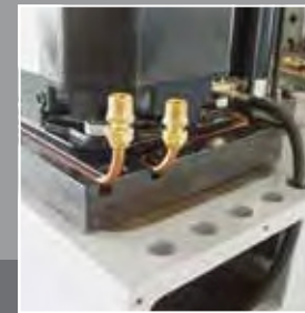
Radiatoren - Platte