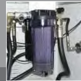
IKZ - Doppelfilter - System